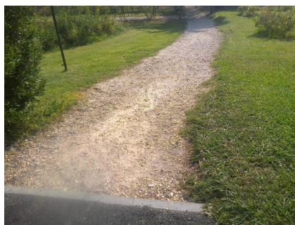
il vialetto del roseto da rifare