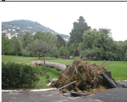
l'ultimo dei 9 esemplari di pini crollati insieme a palme lecci e cipressi dal 2010

-- il comune non può farsi risarcire da IREN per i danni del crollo dei pini, dovuti ai lavori del collettore fognario.